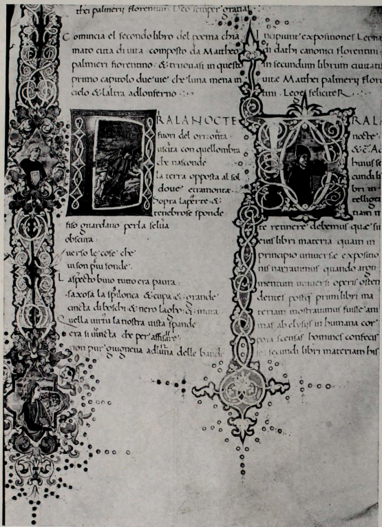
Cod. Laurentian XL 53, f. 124 (part)