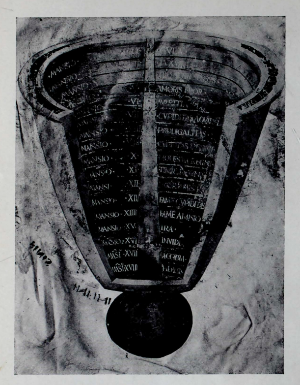
Miniature of Hell, Cod. Laur. XL 53 f. 10